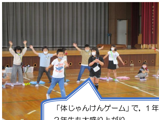
「体じゃんけんゲーム」で、1年生も2年生も大盛り上がり。