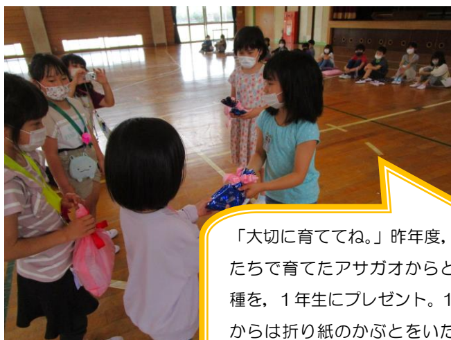
「大切に育ててね。」昨年度、自分たちで育てたアサガオからとれた種を、1年生にプレゼント。1年生からは折り紙のかぶとをいただきました。