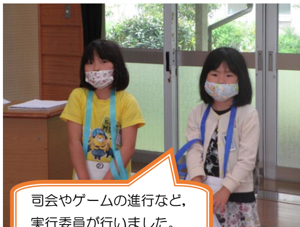
司会やゲームの進行など、実行委員が行いました。