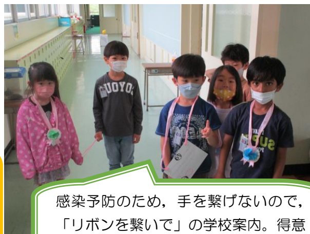
感染予防のため、手を繋げないので、「リボンを繋いで」の学校案内。得意気に学校のことを教えていました。