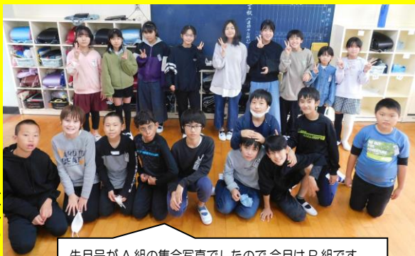
先月号がA組の集合写真でしたので、今月はB組です。

10月下旬まで、できるだけ密を避けるということから6年生を2つの教室に分けて学校生活を送っていましたが、今週から1つに戻し、元の生活に戻りました。感染状況により、今後も柔軟に対応していこうと思っています。(卒業まで昨年6年2組が使用していた2棟の教室を使用していきます。)